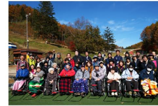
第1回 ユニバーサルイベント

昼神☆プレミアムサポートの活動を南信州地域に普及しようと、旬わくわくと阿智☆昼神観光局と介護のかふねの三者で協議を続け発足。南信州地域で、障害(個人的な生きづらさ)を持っている人も、持っていない人も“一緒に”「住み慣れた地域・場所で、安心して出かけたり楽しんだりできる地域」を作り上げることが目的とし、南信州地域への普及活動を実施するチーム。